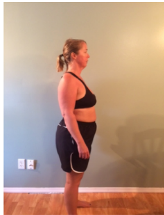
Aug 9, 2016