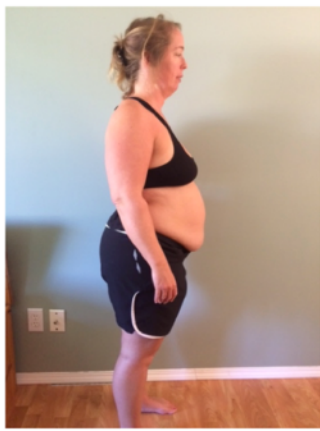
June 4, 2016